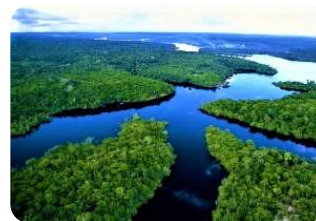
アマゾンのジャングル

ポイントは 確認できる 生物です。1 つ目の答えです。これは私にもわかりました。答えは「植物（樹木）」です。はるか 400km 上空からも緑色の植物は確認でき、特にアマゾンなどの植物が密集したジャングルはしっかり確認できるそうです。もう 1 種類は何でしょうか？