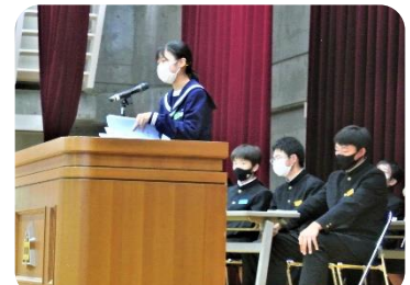
生徒からの質問に対し丁寧に回答する専門委員長

提案は、全校生徒の賛成多数により承認を得て、後期の生徒会活動が本格的に始動しました。