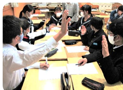
合唱練習のルールについて話し合う実行委員 (10月25日、第1回実行委員会)